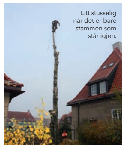
Litt stusselig når det er bare stammen som står igjen.

Stamme og grener blir kappet opp i passende lengder som vil gi mye god varme i vedovnen hvis de blir tørket.