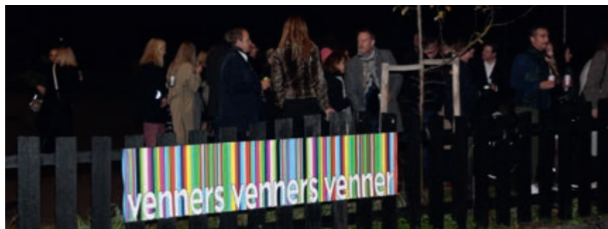
Først når alle hadde kommet sammen på Eventyrplassen, fikk vi vite hvor avslutningsfes- ten skulle avholdes.

Stemningen blir enda mer løsslup- pen her, og om det skyldes det noe mer ungdommelige vertskapet, litt forhøyet