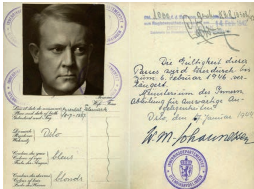
Vidkun Quisling reiste flere ganger til Tyskland. Her er diplomatpasset hans som ble utstedt 17. januar 1944.

BLOD I UKRAINA Den erfarne journalisten, som tidligere jobbet for Dagbladet, VG og Aftenposten og nå er ansatt i NRK,