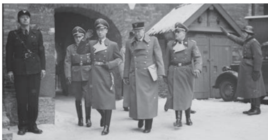
Her er Vidkun Quisling sammen med Joseph Terboven på Akershus festning i 1942