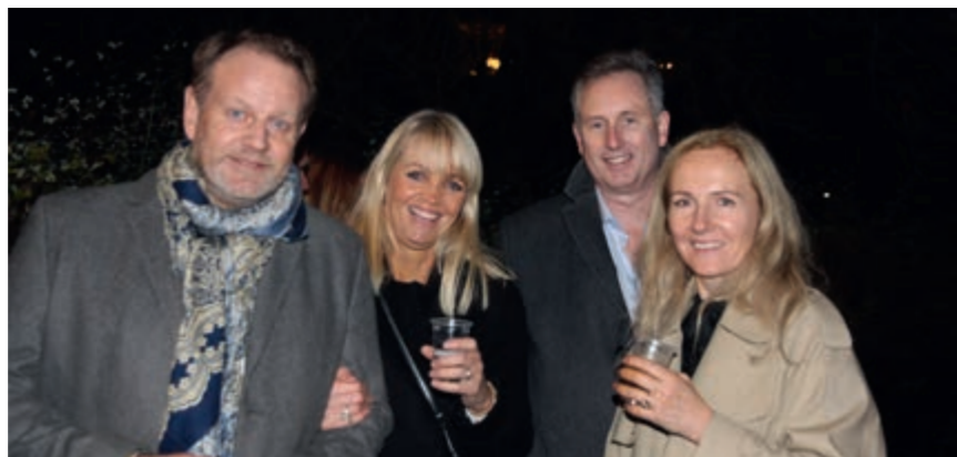
- Ta bilde av oss da, roper disse fire deltakerne på vei mot avslutningsfesten på Ullevaal stadion, og vi lar oss ikke be to ganger.

Hadde jeg kommet på tittelen til den- ne reportasjen mens jeg ruslet hjem etter festen, hadde jeg nok sunget videre ... jo gladere blir vi, for mine venner er dine venner ... ■