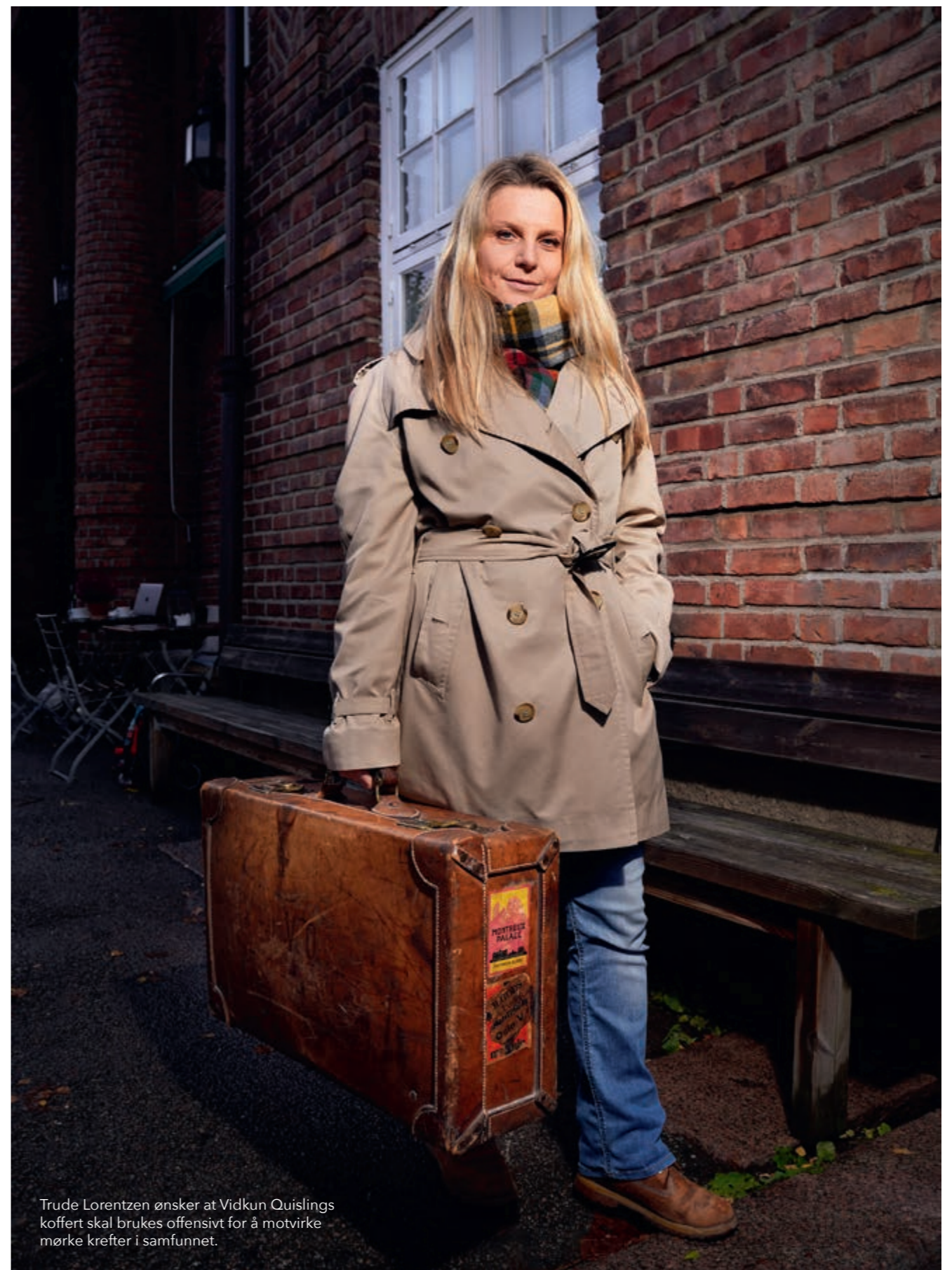
Trude Lorentzen ønsker at Vidkun Quislings koffert skal brukes offensivt for å motvirke mørke krefter i samfunnet.