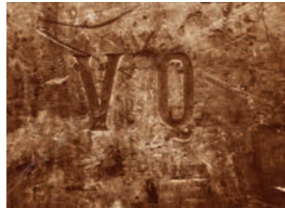
Initialene på kofferten til Quisling.