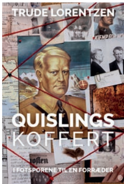
Boken Quislings koffert (Kagge) bygger på den rekordpopulære podkasten av samme navn, men har mye nytt å by på.

– Jeg føler at det nesten blir feil å si at boken er spennende, for akkurat nå skjer det at barn blir drept i gatene i Ukraina der Quisling en gang var, sier hun ettertenksomt.