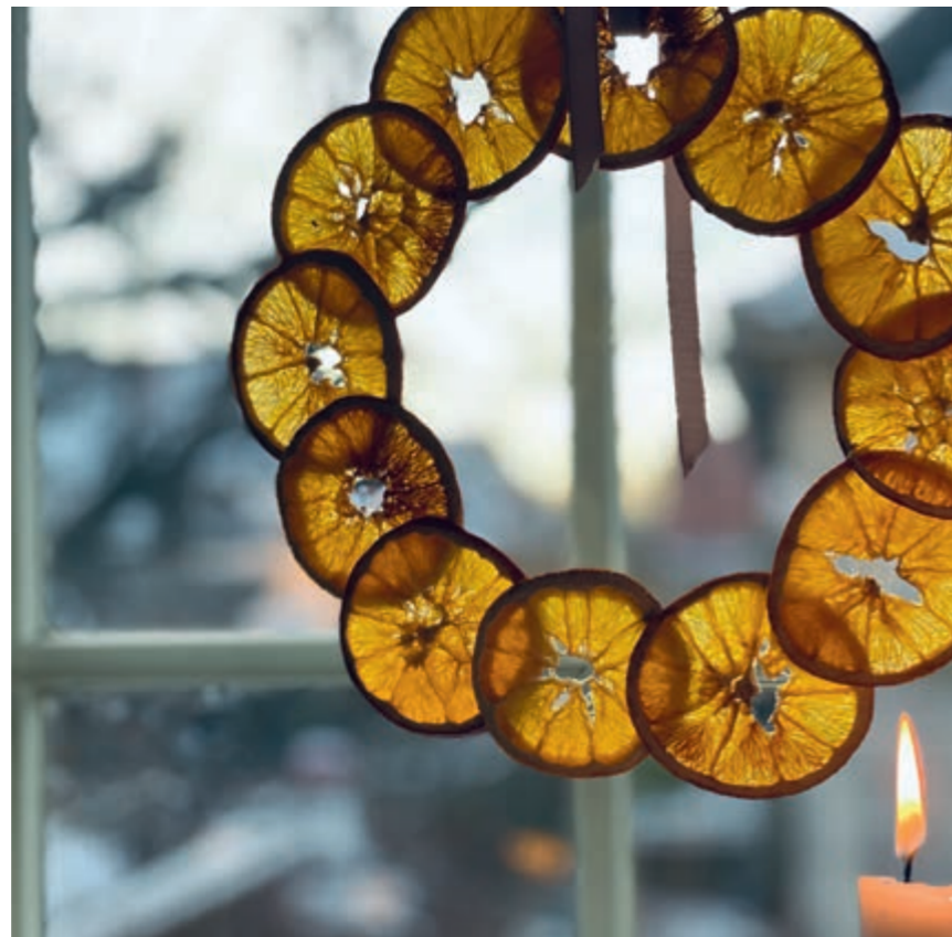
Tørkede appelsinskiver er effektivt pynt til kranser, pakkepynt og girlander.

Jul i hagebyen er en sanselig og stemningsfull julebok proppfull av inspirasjon til julegaver, juledekorasjoner og julemat som du enkelt kan lage selv. Victorias kreativitet og estetiske blikk for detaljer kom-