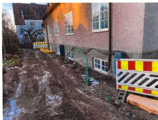
Lysgraver fjernes i forbindelse med drenering i John Colletts allé.